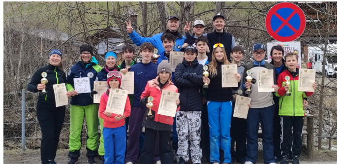
Euer SC Reichertshofen

Wir gratulieren allen Teilnehmenden von ganzem Herzen zu ihrer tollen Leistung!