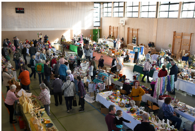
Eine beeindruckende Präsentation von hochwertigen Osterdekorationen und Kunstwerken gab es auf der diesjährigen Osterausstellung der Hobbykünstler und Kunsthandwerker an der Paar.