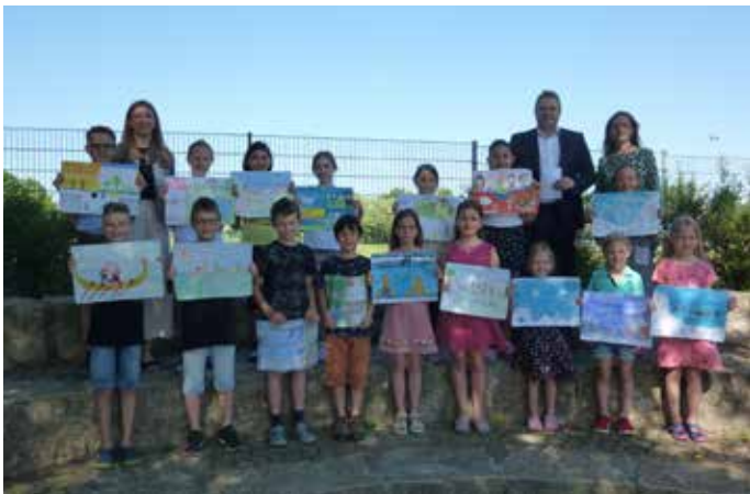
16 stolze Grundschüler bei der Preisverleihung auf dem Pausenhof der Grund- und Mittelschule Reichertshofen