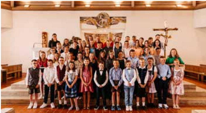
Firmung Reichertshofen: Firmung Langenbruck