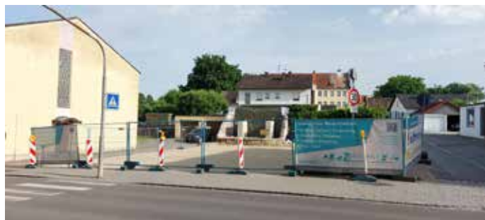
Der Markt Reichertshofen spart über 386.000 Euro beim Neubau eines Bürogebäudes an der Marktstraße 16: die Marktgemeinde investierte auf der letzten Sitzung 2,241 Millionen Euro in kosteneffiziente Verträge und umweltschonende Ausstattung.

Die Untersuchung ergab, dass zwei Schächte - einer in Richtung Freinhausen und einer in Richtung Winden - neu gebaut werden müssen. Darüber hinaus werden vier weitere Schächte im Zuge anderer Baumaßnahmen, beispielsweise bei der Sanierung der B300, abgewickelt. Drei Schächte sind ebenfalls sanierungsbedürftig. Der Neubau wird mit einem monolithischen Kunststoffsystem ausgeführt, die Gesamtkosten des Projekts belaufen sich auf 170.000 Euro. vor